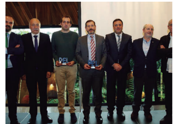
Los galardonados junto a las autoridades provinciales

Tras la entrega de los premios. Los organizadores del evento invitaron a todos los asistentes a un coctel.