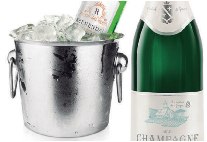
Detalle de los materiales Plus de Avery

Así mismo, y tras las diferentes reglamentaciones de la Unión Europea sobre el uso de ciertas sustancias en el sector, esta multinacional ha incrementado