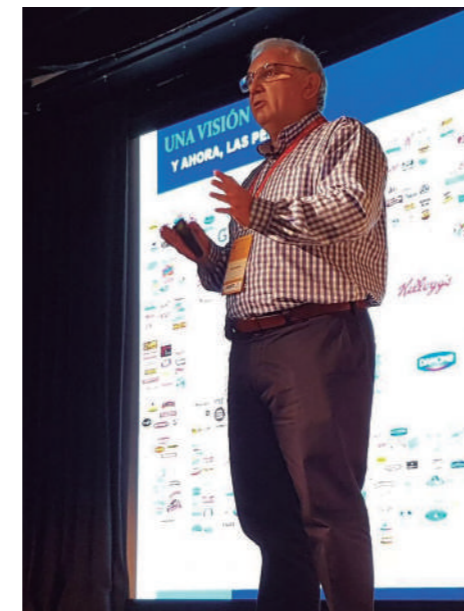
Momento de una de las ponencias del Congreso