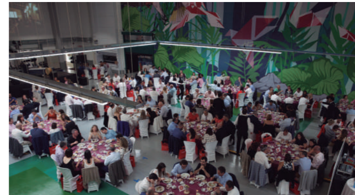
Los invitados durante la cena oficial

Aprovechando esta celebración y la presencia de tantos invitados se ha procedido a inaugurar oficialmente la nueva nave en la que ya estamos trabajando desde hace apenas unos meses.