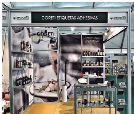
Distintas vistas del stand de Coreti en la feria